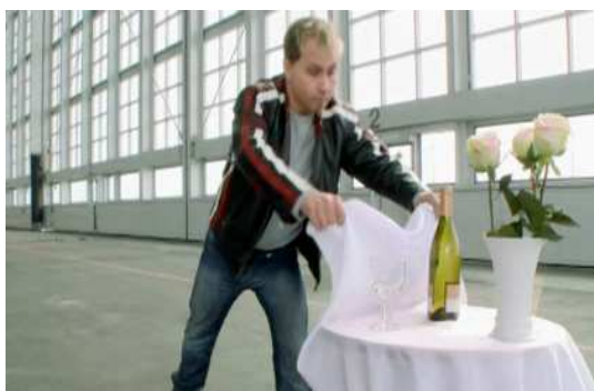
Figura 7: Representação da segunda situação problema sobre o conceito de primeira lei de Newton.