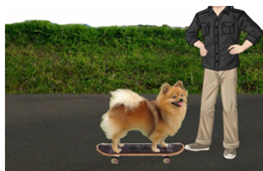
Figura 3: Animação 4