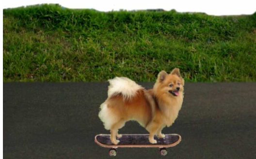
Figura 2: Animação 3